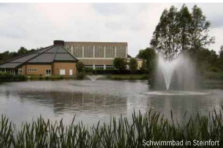
Schwimmbad in Steinfort

Die Schulklassen aus Tütingen und Hollenfels benutzen den « Koscheschbau » in Tütingen. Für die Schulklassen aus Simmern ist das Turnen jeweils Mittwochs in Eischen.