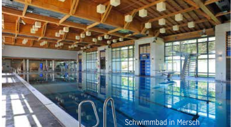
Schwimmbad in Mersch