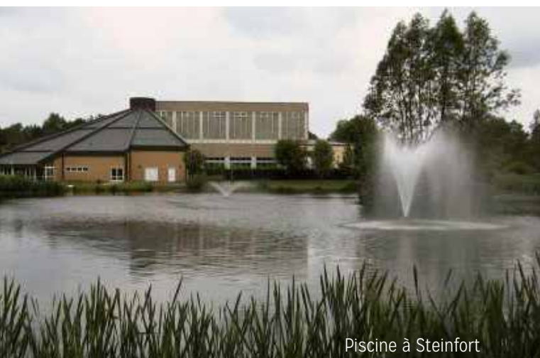
Piscine à Steinfort

Les cours d'éducation physique sont assurés par les titulaires de classe, respectivement par les chargés de cours. Les classes de Tuntange et Hollenfels se rendent à Tuntange au «Koschteschbau». L'éducation physique pour l'école de Septfontaines se tient à Eischen.