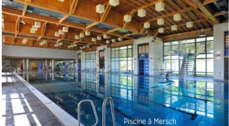
Piscine à Mersch