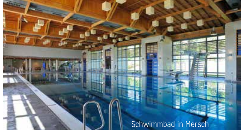
Schwimmbad in Mersch

Der Schwimmunterricht findet jeden Montagmorgen in der Schwimmhalle in Steinfort statt.