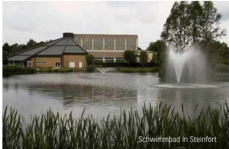
Schwimmbad in Steinfort