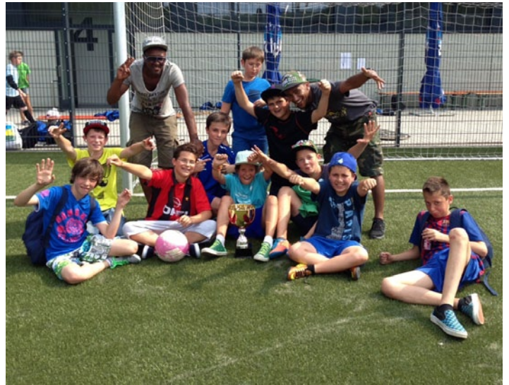
Les jeunes footballeurs de la Maison Relais de Hobscheid, vainqueurs des coupes aux tournois de football: à gauche: vainqueurs du tournoi organisé par la maison relais de Hobscheid (29 mai 2013) à droite: vainqueurs pour la troisième fois de suite du tournoi organisé par Inter-Actions au Pfaffenthal (16 juillet 2013).