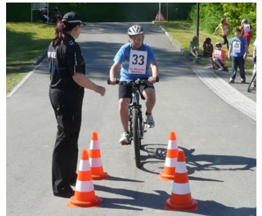
Photos d'activités du primaire 2012-2013 (journée pompiers et coupe scolaire)