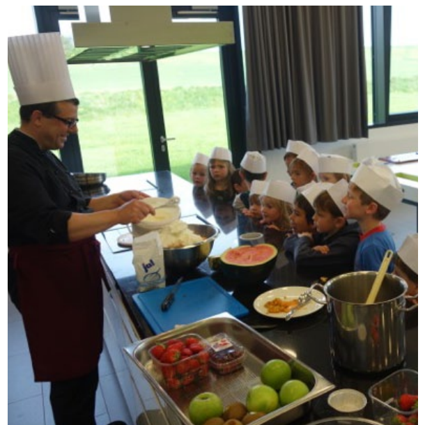
Photos d'activités du préscolaire 2012-2013 (enregistrement CD, visite ferme pédagogique et visite Luxlait).