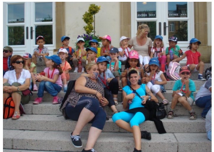
Photos d'activités de la maison relais d'Hobscheid 2012-2013 (e.a.: Kanner in the city, été 2013).