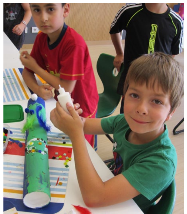
Photos d'activités de la maison relais d'Eischen 2012-2013 (e.a.: Ritterfest à Vianden).