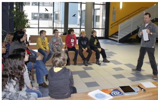
Photos prises lors de la Science Week (novembre 2012).